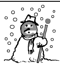
de la neige