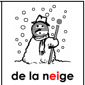
de la neige