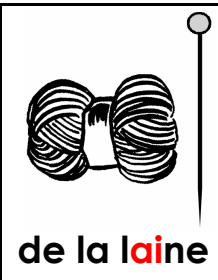
de la laine